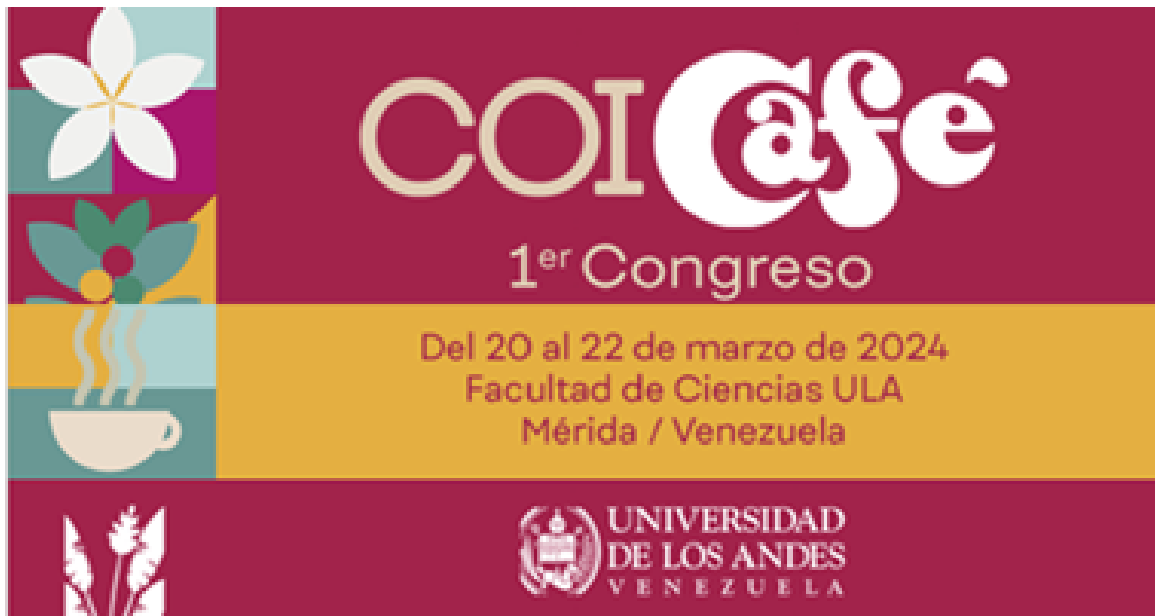
Afiche modificado del Primer Congreso Internacional del Café de Mérida

Cámara Empresarial Venezolano-Coreana CAVENCOR