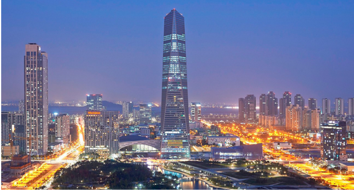
Songdo primera ciudad inteligente del mundo creada desde cero en Corea del Sur

Cámara Empresarial Venezolano-Coreana CAVENCOR